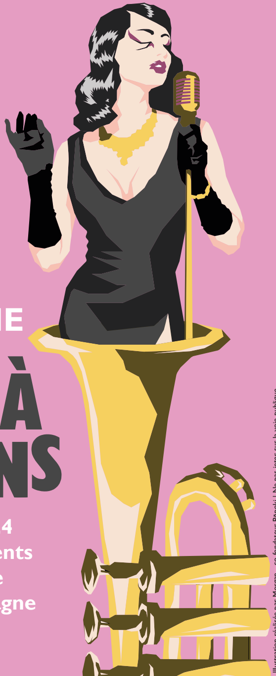
Illustration réalisée par Morgan - co-fondateur Popoki | Ne pas jeter sur la voie publique